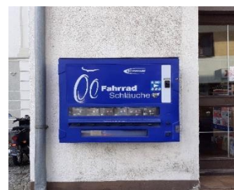
Ersatzfahrradschläuche bei Huck