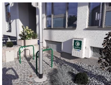
E-Ladestation bei der Sparkasse