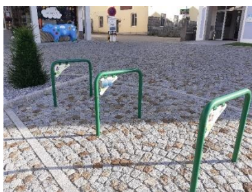
E-Ladestation am Rathausplatz

Es ist sehr erfreulich, dass immer mehr Radfahrer/-innen aus Peuerbach und Steegen zu sehen sind, welche ihren Einkauf bzw. kleine Erledigungen per Fahrrad durchführen. Falls es mal technische Probleme gibt, möchte Leopold Gfellner, Radbeauftragter von Peuerbach und Steegen auf die bereits vorhandenen Service-Stationen (Fotos) hinweisen.