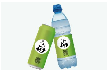
Neu ab Jänner 2025: das Einweg-Pfand

Am 1. Jänner 2025 startet in Österreich das Einwegpfand auf Kunststoff- und Metall-Getränkeverpackungen: Beim Kauf einer Einweg-Getränkeflasche oder Getränkedose werden 25 Cent Pfand eingehoben. Das trifft auf alle geschlossenen Getränke in Kunststoffflaschen und Metalldosen mit einer Füllmenge von 0,1 bis 3 Liter zu, die mit dem Pfandsymbol gekennzeichnet sind. Die Flaschen und Dosen können an allen Verkaufsstellen zurückgegeben werden, an denen sie ausgegeben wurden. Ausnahmen sind Getränkeautomaten sowie Post- und Paketzusteller. Wichtig ist, darauf zu achten, dass die Verpackungen leer und unzerdrückt sind. Achtung: In der Übergangsphase werden auch noch Flaschen und Dosen ohne Pfandsymbol im Verkaufsregal stehen!