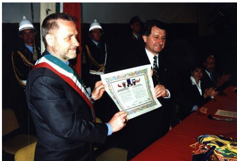
Am 31. Mai 1997 wurde unter Anwesenheit einer Peuerbacher Delegation die Partnerschaftsurkunde in Malo unterzeichnet.