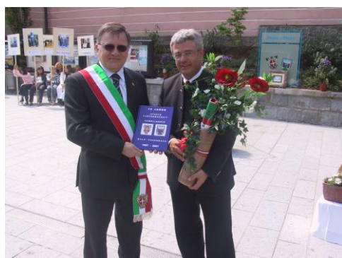
Feier in Peuerbach am 29. April 2007