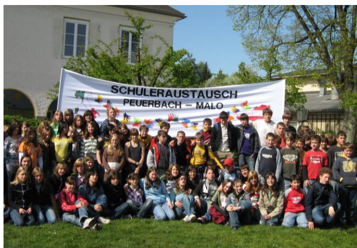
Gruppenfoto in Peuerbach 2007 mit der neuen Schulpartnerschaftsfahne.