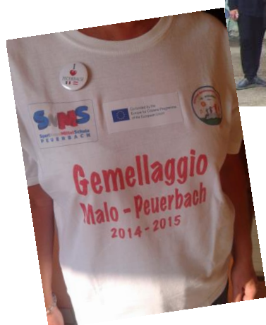
Freundschafts-T-Shirt Schüleraustausch 2014/2015