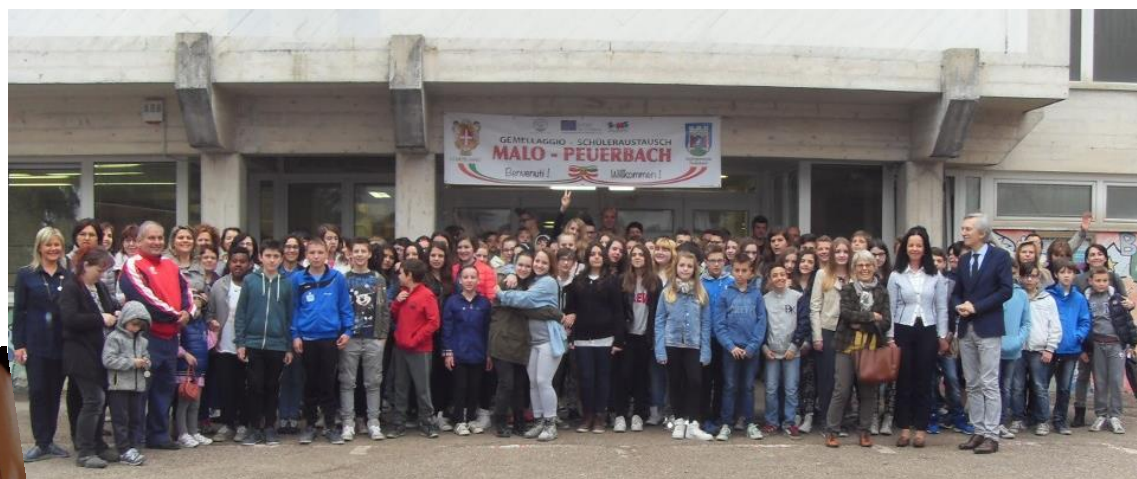
Gruppenfoto in Malo 2008 vor der Scuola Media