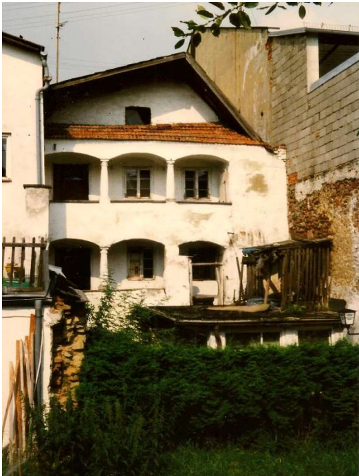
Rückseite des Hauses mit dem Säulengang im ersten und zweiten Stock des Hauses

Habe ich bereits von diesem Haus betreffs einer sehr traurigen Begebenheit im Jahre 1868, also vor 158 Jahren berichtet ( Doppelmord ), so kam es in diesem Hause Innerer Markt Nr: 5 - Seifensiederhaus - ( heute Hauptstraße Nr: 13 - Stadt - Imbiss ) auch zu einem erfreulichen Vorfall.