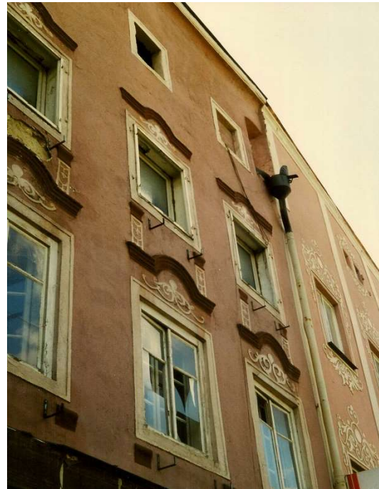
Vorderansicht des Hauses - Hauptstraße Nr: 13 mit den schönen Fenstergesimsen

Dieses Haus hatte an der Hinterfront in jedem Stockwerk einen überdachten Raum, einem Gang oder Balkon ähnlich. Sehr schöne runde steinerne Säulen bildeten einen traumhaften Anblick der Fassade und der Schönheit auch an der Rückseite des Hauses.